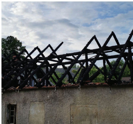
Slika 3: Posledice dimniškega požara – prenos požara na stavbo