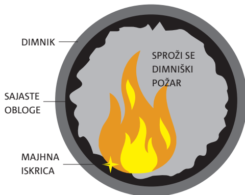
Slika 1: Nastanek dimniškega požara