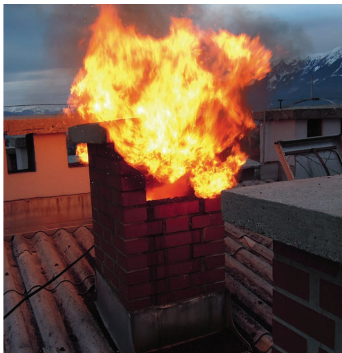
Slika 2: Dimniški požar v razviti fazi – pomembnost lokacije ustja dimovodne naprave