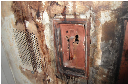
Slika 4: Poškodbe dimnovodnih naprav

Lastnik oz. uporabnik je dolžan omogočiti in zagotoviti redno letno neodvisno meritev emisije dimnih plinov, da se preveri vplive kurilne naprave na okolje, učinkovito rabo energije, tlačne razmere in prisotnost nevarnih koncentracij CO v dimnih plinih.